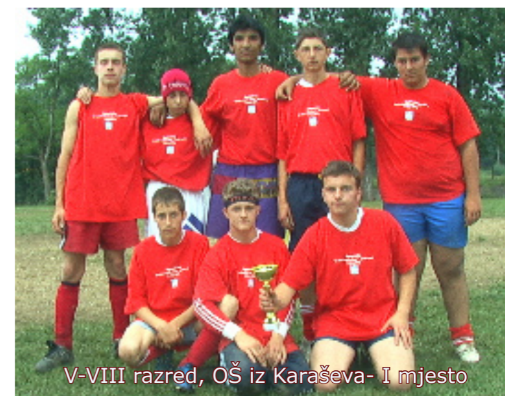
V-VIII razred, OŠ iz Karaševa- I mjesto