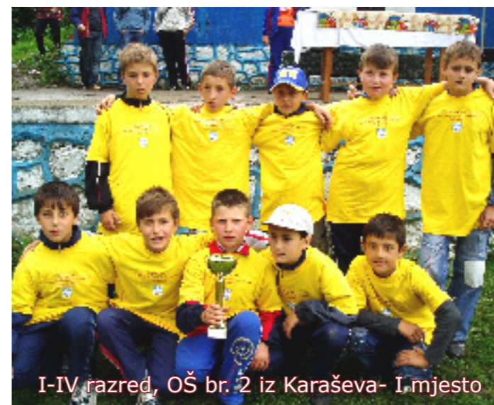
I-IV razred, OŠ br. 2 iz Karaševa- I mjesto