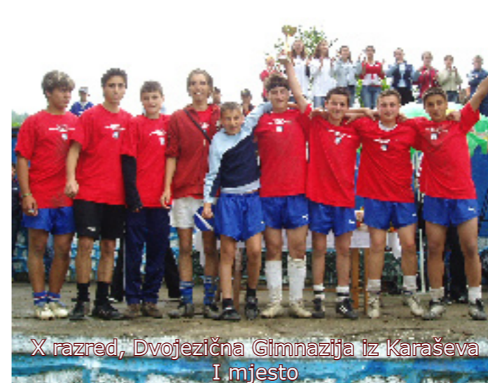
X razred, Dvojezična Gimnazija iz Karaševa I mjesto