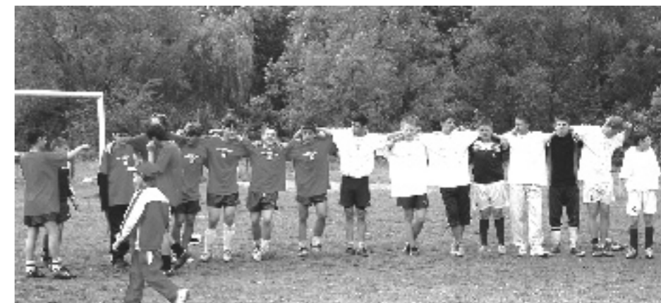
Zajednička slika dviju prijateljskih momčadi

IX-XII). Vrijedi još spomenuti koje škole i koji razredi su participirale na natjecanju. U lupačkoj općini bile su: Škola Lupak I-IV, Škola Klokoči I-IV, Škola Vodnik I-IV, Škola Lupak V-VIII, Škola Klokoči V-VIII, Škola Ravnik V-VIII. U karaševskoj općini: Osnovna škola br. 1. Karaševo, Osnovna škola br. 2. Karaševo, Osnovna škola Nermid, Osnovna škola Jabalče, razred V-A Karaševo, razred V-B Karaševo, razred VI-A Karaševo, razred VII-B Karaševo, razred VIII-A Karaševo, razred IX-A Karaševo, razred IX-SAM Karaševo, razred X Karaševo, razred XII Karaševo.