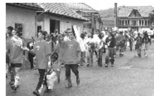
Igrači žure prema nogometnom terenu

Prije par tjedana, 30, 31, i 1.05.2007., u našim je selima bilo organizirano športsko nogometno natjecanje učenika karaševskih škola pod nazivom "Hrvatska Grančica-Junior, I-izdanje-od mini do maxi". Organizator natjecanja bio je Zajedništvo Hrvata u Rumunjskoj. Prve kvalifikacijske igre