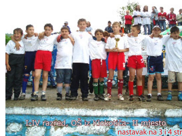
I-IV razred, OŠ iz Klokotiča- II mjesto nastavak na 3 i 4 str.