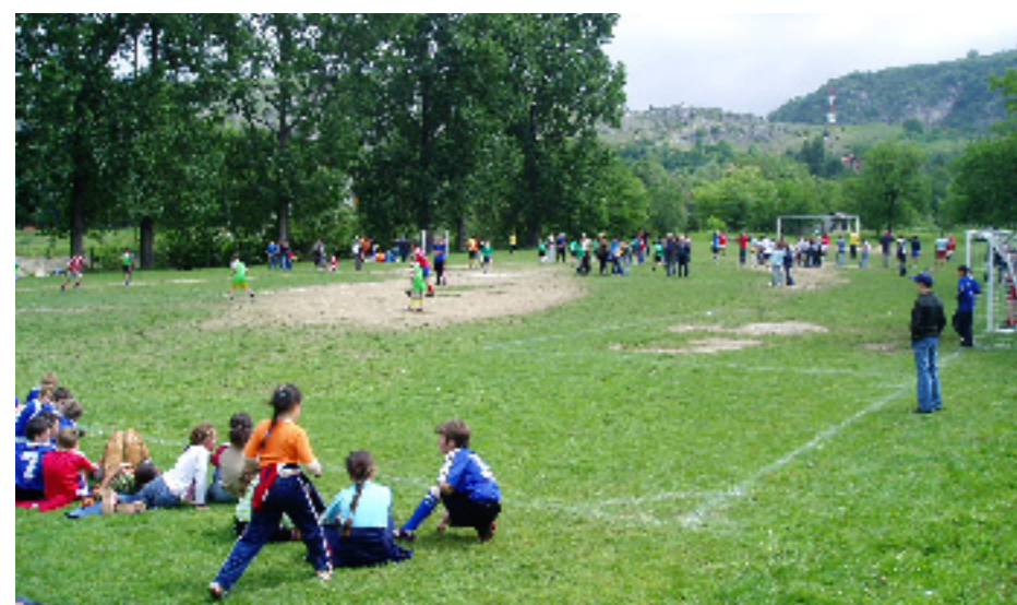
Gledatelji pažljivo prate odvijanje važne utakmice na igralištu u Karaševu

Kup „Hrvatska Grančica“, organiziran povodom „Međunarodnog Dana Djeteta“, predstavljao je aktivnu, korisnu i rekreativnu djelatnost za integriranje djece u homogenu zajednicu. Materialna i moralna podrška ZHR-a glede očuvanja našeg etničkog identiteta potvrđuje se i putem dječjih nogometnih utakmica.