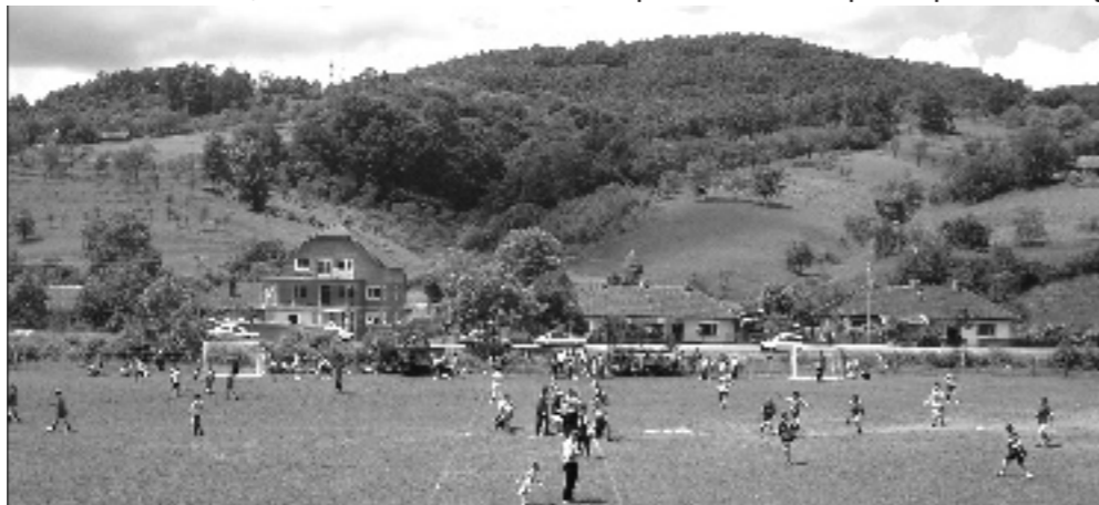
Paralelno odvijanje dviju utakmica na prelijepom lupačkom igralištu

Vodnik – Klokoči (0 – 2). Strijelci su bili Banac Milorad u prvom poluvremenu, a u drugome je Filca Marian dokončao utakmicu krasnim golom. Međutim, iako